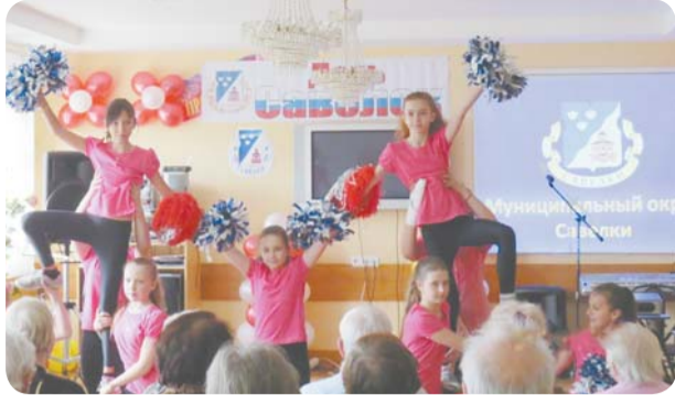
28 апреля 2014 года в филиале «Савелки» ГБУ ТЦСО «Зеленоградский» состоялось праздничное мероприятие, посвященное Дню местного самоуправления.

День местного самоуправления отмечается в нашей стране уже второй год. Указ Президента Российской Федерации В.В. Путина от 10 июля 2012 года гласит: «В целях повышения роли и значения института местного самоуправления, развития демократии и гражданского общества установить День местного самоуправления и отмечать его 21 апреля, в день издания в 1785 году Жалованной грамоты городам, положившей начало развитию российского законодательства о местном самоуправлении».